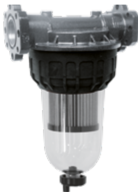
CLEAR CAPTOR STRAINER