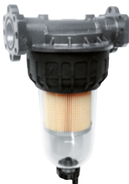
CLEAR CAPTOR FILTER