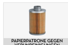
PAPIERPATRONE GEGEN VERUNREINIGUNGEN