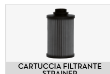
CARTUCCIA FILTRANTE STRAINER