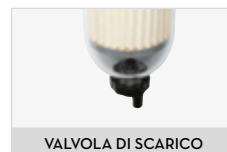
VALVOLA DI SCARICO