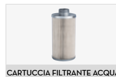
CARTUCCIA FILTRANTE ACQUA