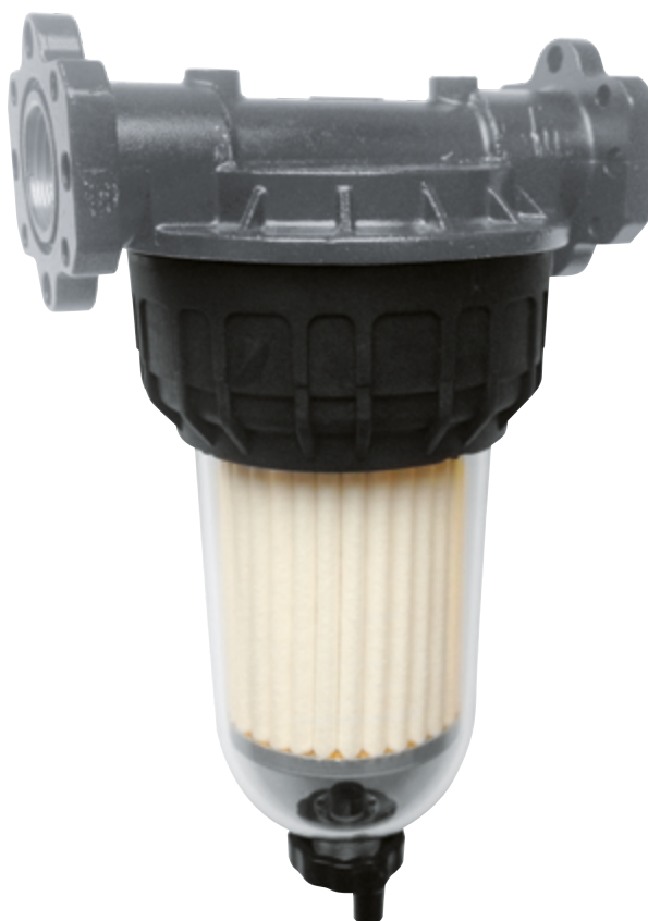
CLEAR CAPTOR WATER FILTER CON ASSORBIMENTO ACQUA