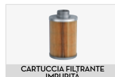
CARTUCCIA FILTRANTE IMPURITÀ