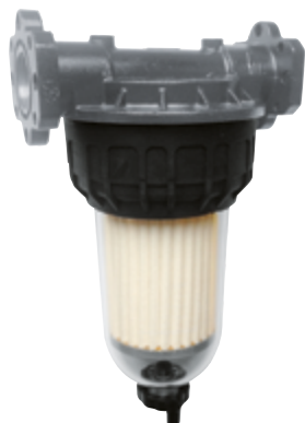
CLEAR CAPTOR WATER FILTER CON ASSORBIMENTO ACQUA