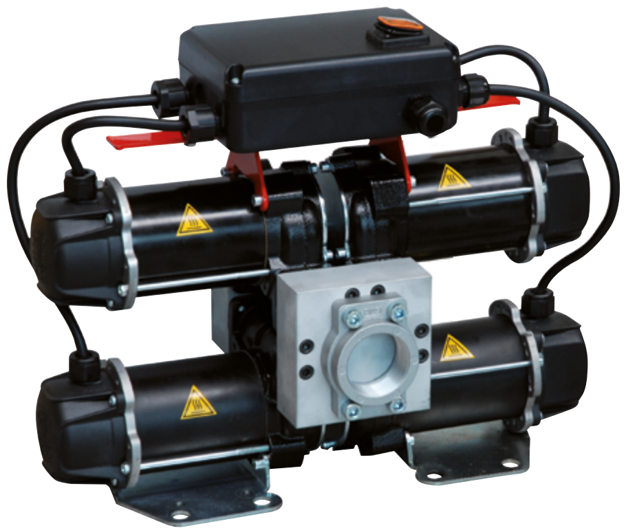
ST 200 DC