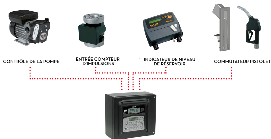
SCHÉMA DE CONNEXION