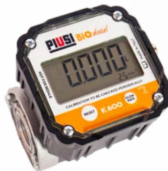
K600 B/3 WITH PULSE-OUT