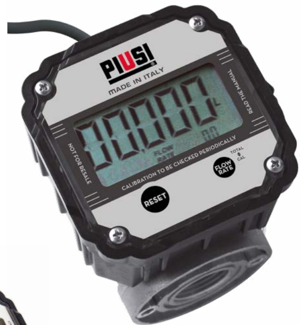
K600 B/3 METER