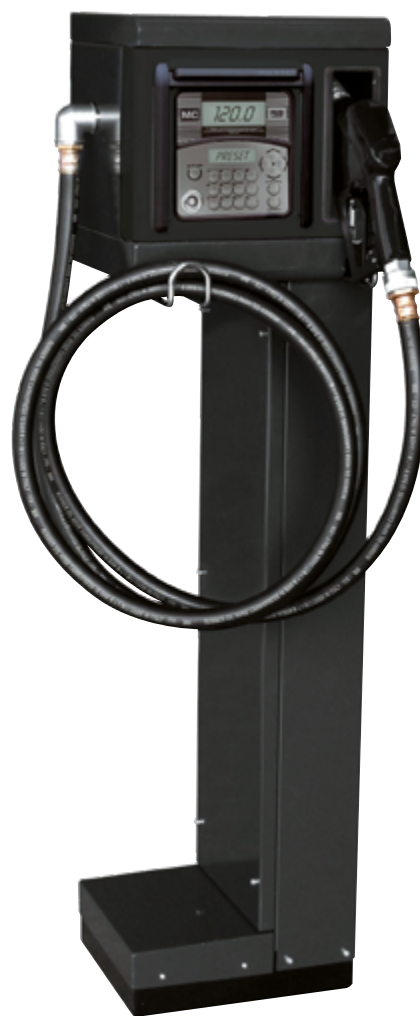
CUBE MC 2.0 MIT SOCKEL (OPTIONAL)