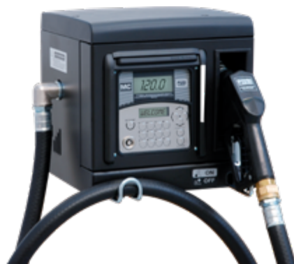
CUBE MC 2.0