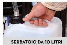
SERBATOIO DA 10 LITRI