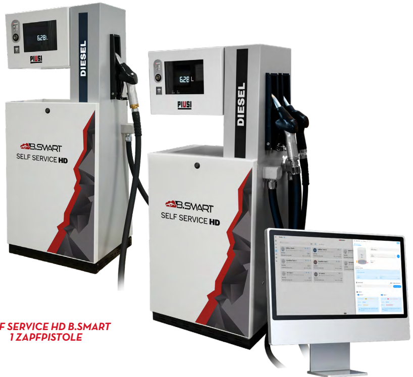
SELF SERVICE HD B.SMART 1 ZAPFPISTOLE