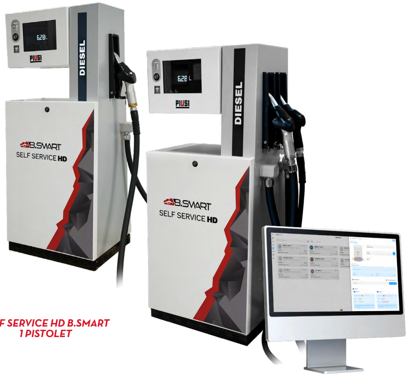
SELF SERVICE HD B.SMART 1 PISTOLET