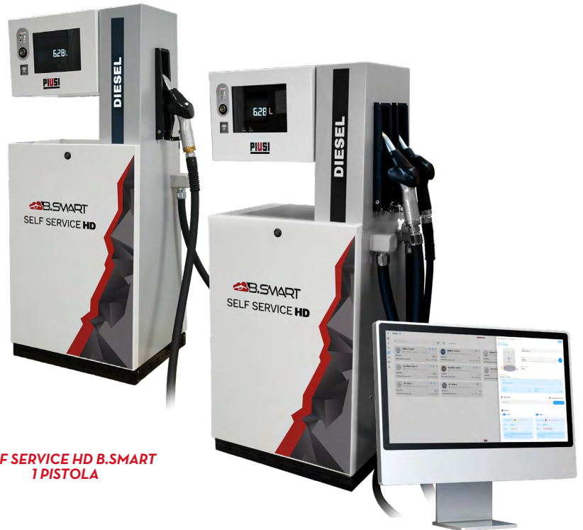
SELF SERVICE HD B.SMART 1 PISTOLA