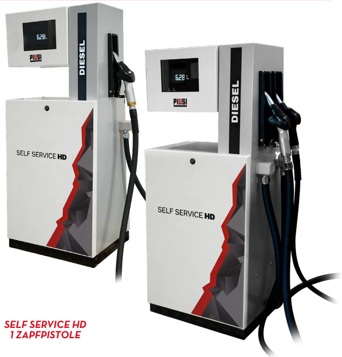
SELF SERVICE HD 1 ZAPFPISTOLE