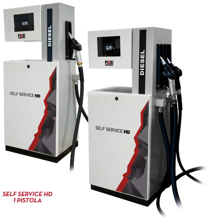
SELF SERVICE HD 1 PISTOLA