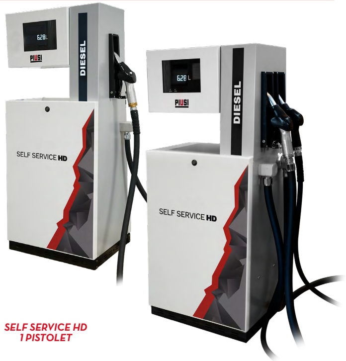
SELF SERVICE HD 1 PISTOLET